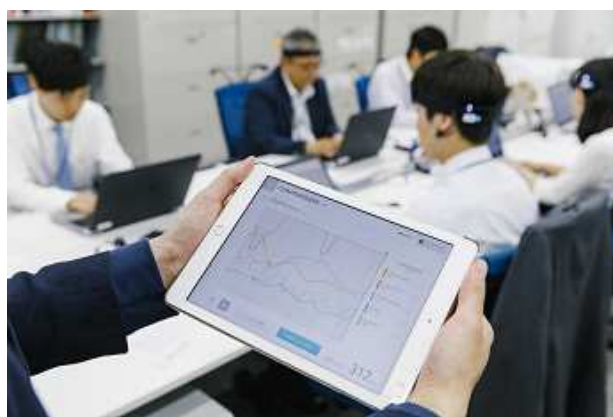
南青山オフィスでの実証実験の様子

【Green Work Style ウェブサイト】 https://www.tokyu-land.co.jp/urban/bldg/gws