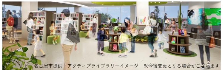
アクティブライブラリーイメージ ※今後変更となる場合がございます

一期 A 区においては複合ビルが新設され、下層階には商業テナント、中層階にはこれまでの名古屋市図書館とは異なる新しいタイプの図書館であり、千種区・東区・守山区・名東区の4区の中核となる、名古屋市初の「アクティブライブラリー」が誕生する予定です。便利でにぎわいがあり、星が丘テラスや菊里高校、椙山女学園大学、東山動植物園など多様な主体が集う、星が丘ならではの環境を生かして、「多くの人に来てもらう図書館」、「連携・協働・交流する図書館」を目指して開発が行われます。