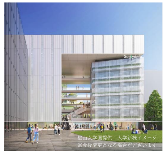
大学新棟イメージ ※今後変更となる場合がございます

働く女性を応援するライフデザインカレッジや課題解決型授業を実践する場を設けるほか、子育て支援拠点、シアター利用も可能な多目的スペース、コワーキングスペースなどを含む、未来の椙山女学園大学を築く象徴的な施設機能を整える予定です。