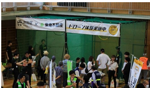
左図：トイドローンの体験ブースの様子

また、室内では子供向けのドローン操作体験ブースを企画・実施したほか、開会式では複数のドローンが色を変えながら規律正しく飛び交うドローンショーも実施しました。