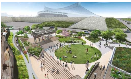
イベントステージ イメージ

公園における環境面では、四季を感じるができる植栽を多数設置し、また多種多様なベンチで人々が思い思いに過ごせる都心のオアシスをめざします。自由で多彩な自己表現と発信ができる場として、公園の中心部分にイベントステージを設置しました。ステージの周囲はもちろん、JR 山手線や代々木競技場の石垣の上など色々な視点から見ることのできるステージを中心に、アート、スポーツなど皆様に楽しむイベントを通じて多くの交流を生み出します。屋外のアーバンスポーツパークは、行く人も見る人も安心してスケートボードなどのアーバンスポーツを楽しめる場所となります。本施設の屋内ゾーンともシームレスにつながりことも可能な仕様になっています。