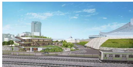
公園および施設 イメージ