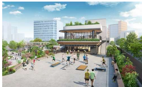
アーバンスポーツパーク イメージ

本施設内には、子どもからシニア世代までが、学び、スポーツ、食を通じて、交流しながら楽しむ機能を持った店舗など、全 8 店舗が入り、訪れる方が新しい挑戦をはじめられる環境ときっかけを提供します。1 階にはハワイ・ワイキキで 20 年続く人気のレストラン「Tiki's Grill & Bar（ティキズグリルアンドバー）」が日本に初上陸。約 160 席の大型ダイニングとして、ハワイを代表する飲食メニューに加え、日本オリジナルメニューを多数揃えます。また、ドッグフレンドリーなレストランとして店内にて犬と一緒に食事を楽しめるドッグメニューや幅広いドッグサービスを提供します。隣接する「NORTH SHORE CAFE（ノースショア カフェ）」では公園にテイクアウトできるマラサダ、アイスクリームやドリンクを提供します。屋上には、バーベキュー広場（2025 年 6 月開業予定）を設置し、公園の緑量と開放感のもと、アーバンバーベキューを楽しむことができます。