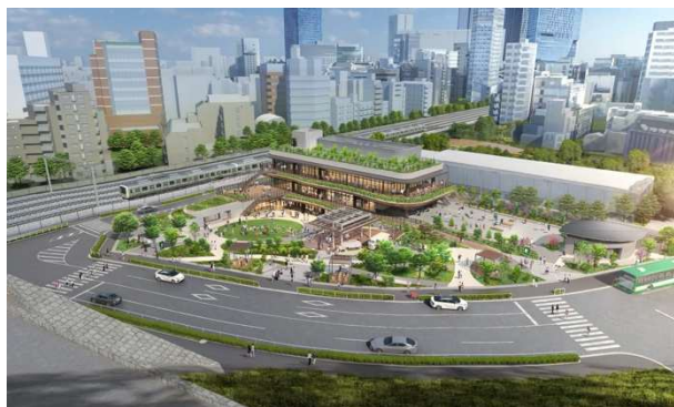
公園および施設 イメージ

都市公園において飲食店・売店などの公園利用者の利便性の向上に資する公園施設（公募対象公園施設）の設置と、設置した施設から得られる収益を活用して、その周辺の園路・広場などの公園施設（特定公園施設）の整備などを一体的に行う民間事業者を公募により選定する、都市公園法において定められる制度