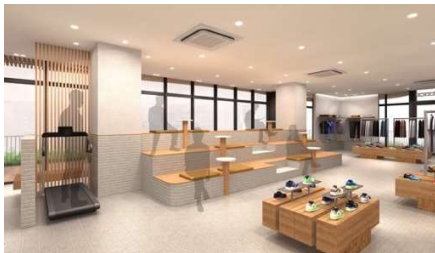
2階「ニューバランス Run Hub 代々木公園」イメージ