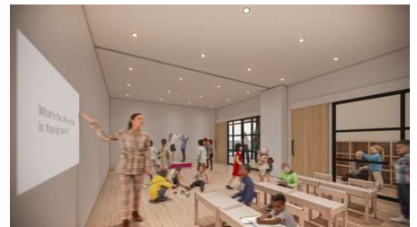
3階「YOYOGI-PARK “まなぶ” イメージ

本事業では、公園が持つ環境を生かし、店舗をはじめ多様なパートナーと連携し協業しながら、スケートボードや、ブレイキンなどのダンスの初心者向けイベント、音楽ライブ、ヨガなど、様々な取り組みを実施していきます。