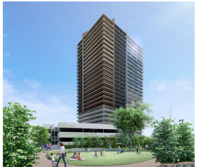
「つながる広場」イメージ