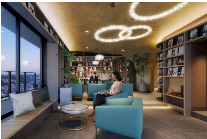
スカイラウンジイメージ

またソフト面では、コンシェルジュサービスの他、株式会社ヤナセとの業務提携による輸入車EVカーシェア、株式会社モンベルの商品を導入した防災備品、住民同士のコミュニティ醸成サービスの「GOKINJO」や地域情報コミュニケーションサービスであるパナソニック株式会社の「まちベル」、さらに多摩美術大学との産学連携によるワークショップなど、東急不動産初の様々なサービスの導入を予定しております。