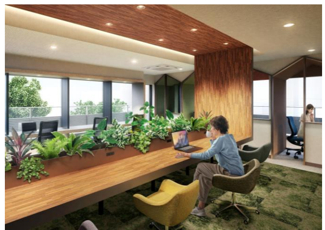
コワーキング・ラウンジイメージ