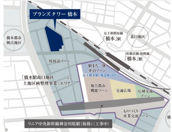
「橋本駅南口地区土地区画整理事業」エリア概念図