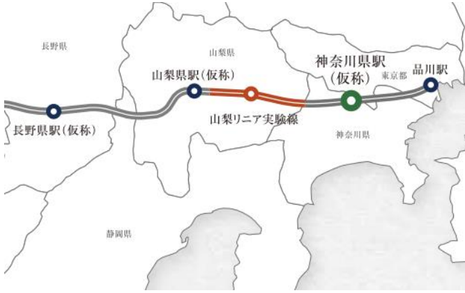
リニア中央新幹線ルート概念図

本物件周辺エリアは、リニア中央新幹線の新駅（神奈川県駅〔仮称〕）開業を見据えた約 13.7ha の大規模再開発（土地区画整理事業）が進行中で、オフィス、インキュベーション施設、商業、福祉・医療機関など多彩な施設集積が計画されており、住む・働く・学ぶ・来訪する人が交流するゲートシティとして都市機能の集積が期待されています。