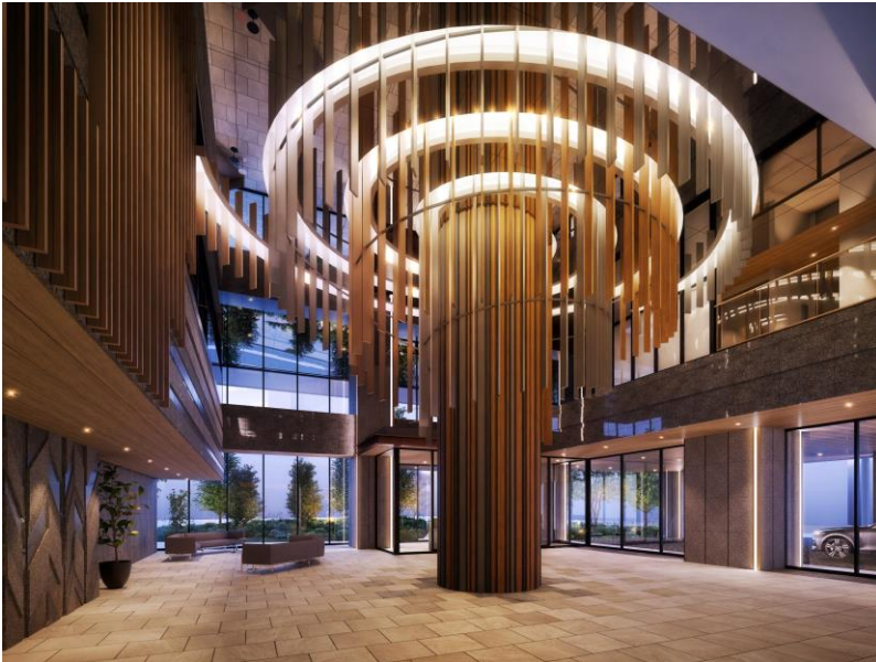
エントランスイメージ

本物件は、「奥多摩・秩父の山並」、「相模川の清流の川面」、「橋本駅方面に正対する都市風景」のそれぞれの特徴をモチーフにした3面のアクシスウォールを備えることで、自然や都市の景観に溶け合う外観ファサードを実現しました。また、2層吹き抜けのエントランスホールには、「雄大な自然の山並・川面」と「未来へと向かう都市風景」が出会う二重螺旋のシンボリックなツリーを設け、本物件のコンセプトを象徴するデザインとなっております。