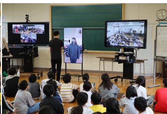
麻生小学校での授業の様子