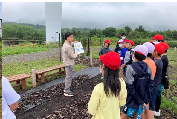
リエネ松前風力発電所見学の様子