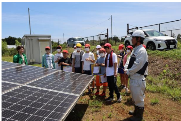
リエネ行方太陽光発電所見学の様子