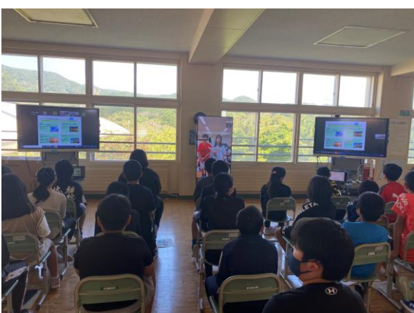
松城小学校での授業の様子

また、2地域を繋ぐ学びの場の開催にあたり、これまで同時性や臨場感が課題でした。この度、MUSVI社の提供するテレコミュニケーションサービス「窓」を活用することで各々の地域・教室の空気も一体的な場を作ることを意図しております。