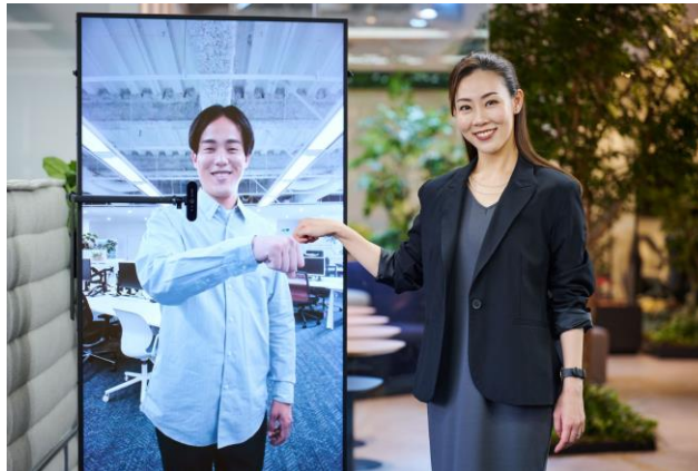
テレビプレゼンスシステム「窓」