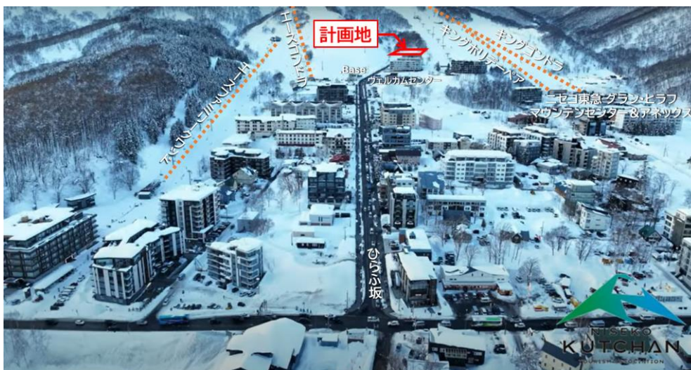
星のやヒュッテ ニセコ (仮称) 計画地

計 画 地 : 北海道虻田郡倶知安町字山田 204 番 2、204 番 69 他 構 造 ・ 規 模 : 鉄筋コンクリート造一部鉄骨構造・地下 2 階 地上 5 階 敷 地 面 積 : 6,462.83 m 2 建 築 面 積 : 2,409.83 m 2 延 べ 面 積 : 14,870.36 m 2 客 室 数 : 62 室 工 期 ( 予 定 ) : 2024 年 10 月 14 日～2029 年 2 月末 ( 予 定 ) 開 業 予 定 : 2029 年度 ( 予 定 ) 施 工 会 社 : 前田・伊藤・盛永・廣野・日軽特定建設工事共同企業体 設 計 者 : 東 環 境 ・ 建 築 研 究 所