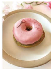
VENUTS サクラマッチャ チート トウキョウ (2F)