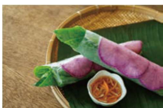
大山鶏と紅芯大根の生春巻き Stand Phở You (4F)