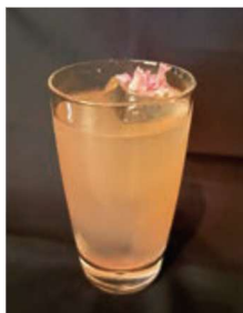
SAKURA Bar Perch 渋谷 (B1F)

テナント各店において、しぶやさくらまつりを盛り上げる春らしい商品やメニューを提供します。一部を紹介します。