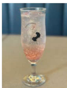
Pincho de サクラ! PiNCHO! 鉄板スペイン串 (1F)