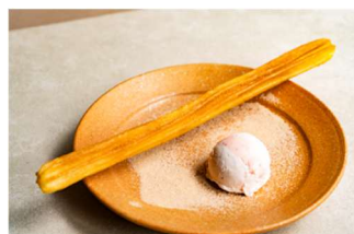
米粉チュロス いちごアイス添え Tippy Tiger (4F)