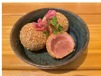
桜あんゴマ団子 水餃子 MR.LEE (4F)