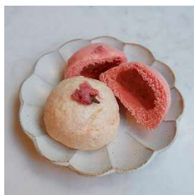
さくらあんまん 中華可菜点心 (4F)