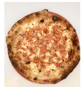
～さくら～ Ciel Pizza (4F)