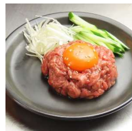
さくら色の和牛炙りユッケ 焼肉 78 (4F)