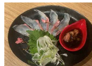
真鯛のお造り桜ポン酢添え 酒場ジャロウ (4F)