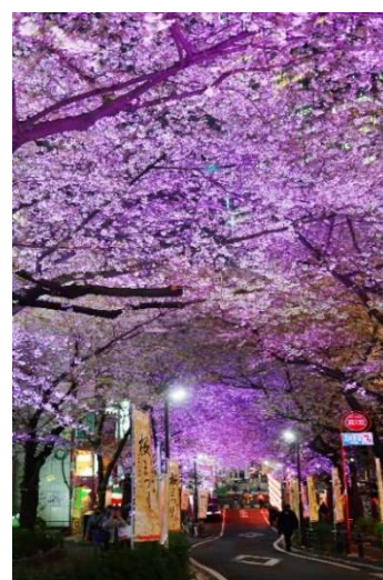
さくら坂ライトアップ

施設を象徴する季節のイベントとして、渋谷サクラステージのイベントスペース BLOOM GATE、にぎわい STAGE、はぐくみ STAGE、桜丘広場においてライブパフォーマンスやグルメイベントなどを開催し、またテナント各店においても春の季節商品、限定商品などを展開します。さくら坂では3月28日(金)18時から桜並木が点灯し、渋谷サクラステージの桜丘広場では提灯のライトアップを行います。前回の初開催時に大きなにぎわいとなった「Sansan 阿波おどり」も4月1日(火)および4月2日(水)に開催します。