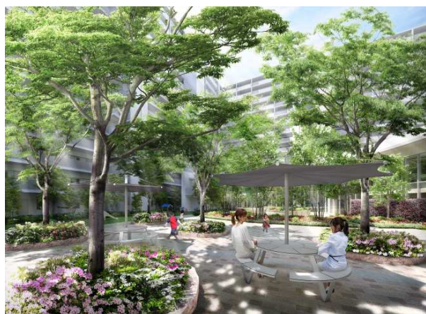
センターフォレスト