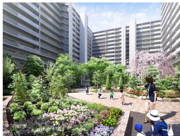
コミュニティガーデン