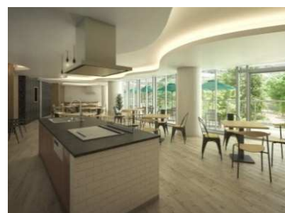
パーティールーム (1・2)