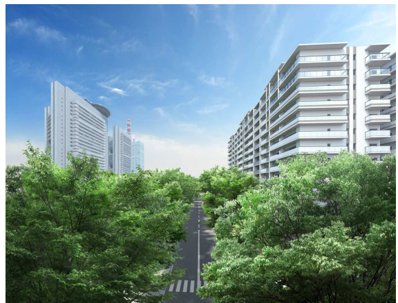
並木道からの建物外観イメージ